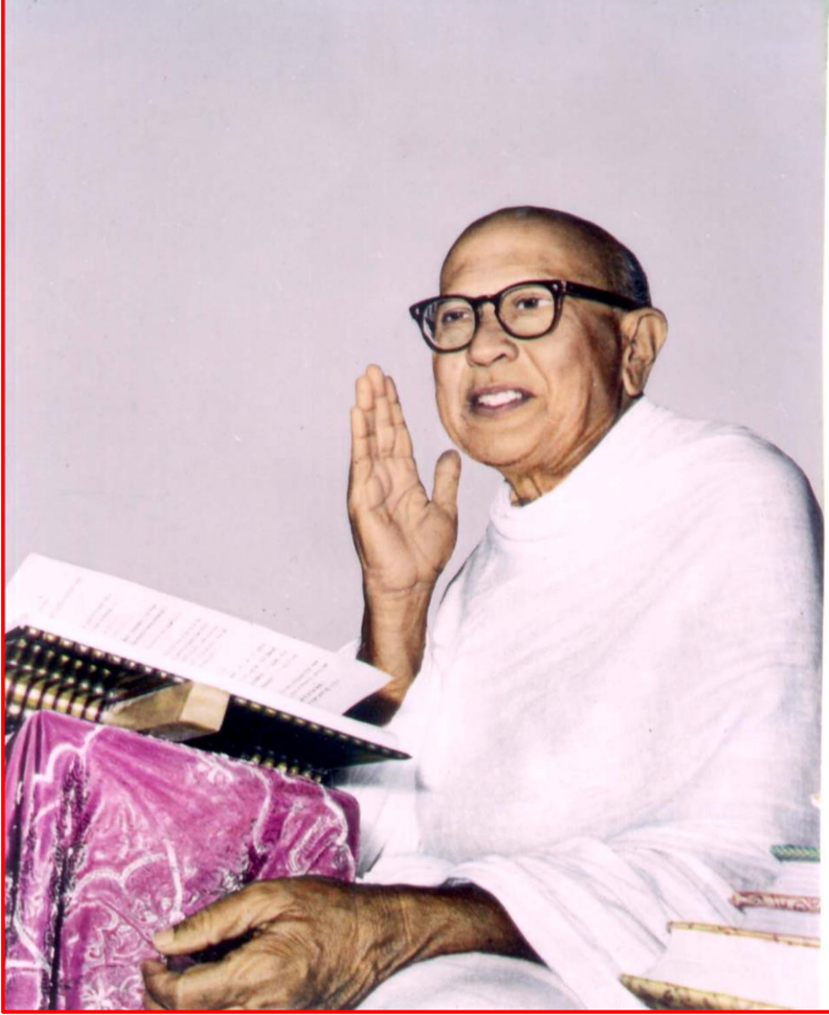
અધ્યાત્મયુગસર્જક પૂજ્ય ગુરુદેવશ્રી કાનજીસ્વામી